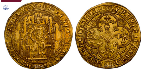
Philippe VI Chaise d'or – NGC MS 63 10 000€