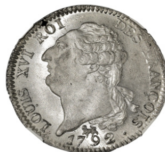
Écu de 6 Livres

Astuce collectionneur : l'état de conservation et la rareté des ateliers de frappe influencent fortement la valeur de ces pièces.