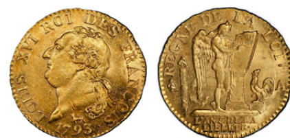
Louis d'or Constitutionnel Louis XVI