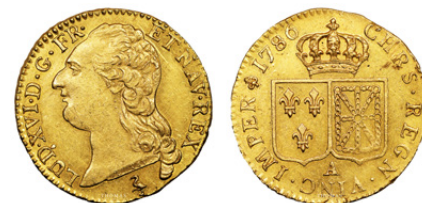
Louis d'or Royal Louis XVI

Les monnaies de la période constitutionnelle de Louis XVI sont bien plus que de simples objets monétaires : elles sont le reflet d'une France en pleine mutation. Que vous soyez collectionneur passionné, investisseur, ou amateur d'histoire, ces pièces constituent un patrimoine précieux, alliant histoire, art et valeur économique.