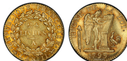
24 Livres or Constitutionnel