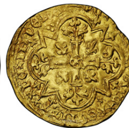
Charles VI Demi-Heaume d'or – La Rochelle PCGS MS 62 – Trésor guerre de cent ans Abbaye de la Lucerne 15 000€

www.thomasnumismatics.com +33 01 79 35 52 65 contact@thomasnumismatics.com