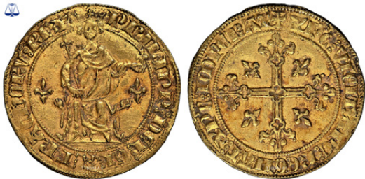
Philippe IV Petit royal d'or – NGC MS 61 45 000€