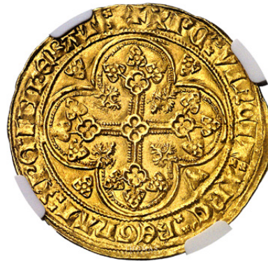
Philippe VI Écu d'or à la chaise – NGC MS 62 3 600€