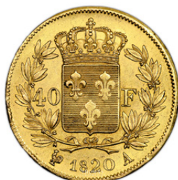
Louis XVIII 40 Francs or – 1820 Date 2/1 – A Paris 5474 exemplaires 3 500€