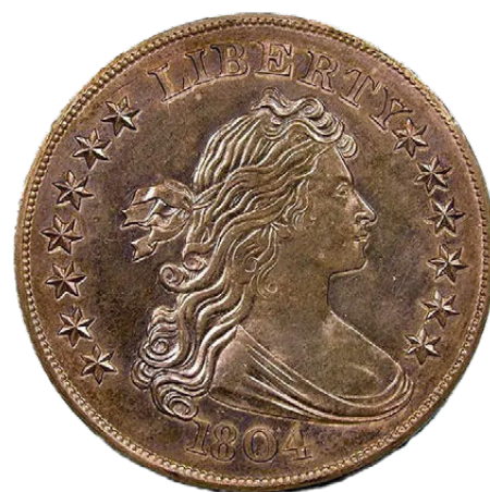
1 Dollar 1804