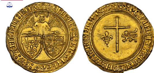
Henry VI Angelot d'or – Rouen – NGC MS 62 35 000€

www.thomasnumismatics.com +33 01 79 35 52 65 contact@thomasnumismatics.com