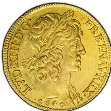
Louis d'or de Louis XIII