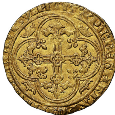
Philippe VI Ange d'or – NGC MS 62 – Trésor de Pontivy 19 500€