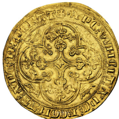
Philippe VI Pavillon d'or 14 000€