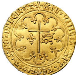
Henry VI Salut d'or – Saint Lô 3 800€