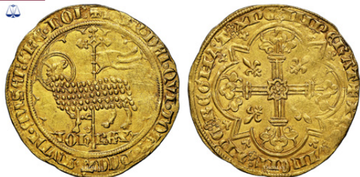
Jean II le Bon Mouton d'or – NGC MS 62 Trésor de Pontivy 7 500€