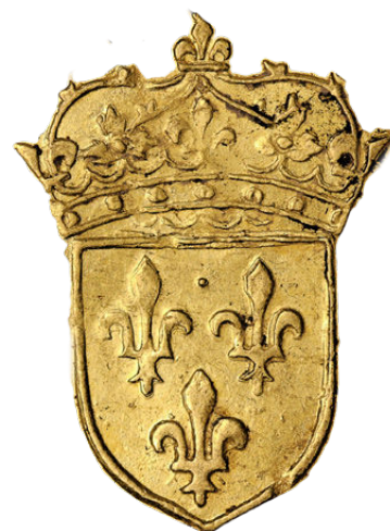
Écu aux fleurs de Lys

Qu'on la collectionne par règne, atelier de frappe ou par type, cette monnaie reste et restera un témoignage tangible du passé royal de la France.