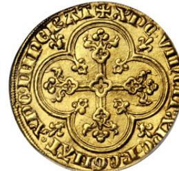
Philippe V Agnel d'or – PCGS MS 62 20 000 €