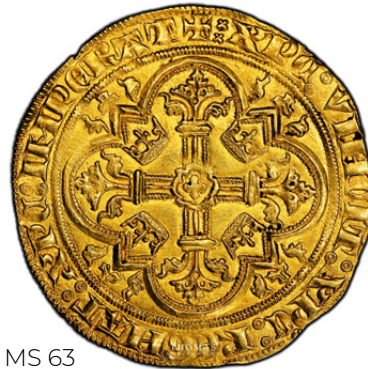
Philippe VI Double d'or – PCGS MS 63 45 000€