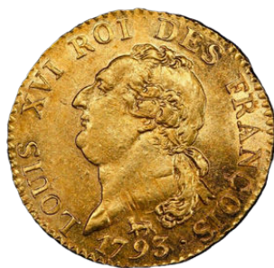
Louis d'or Constitutionnel