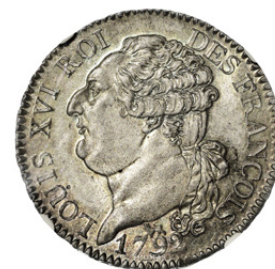
Demi Écu de 3 Livres