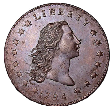
Dollar Flowing Hair

Les pièces de vingt dollars en or ont été frappées aux États-Unis à partir de 1907 jusqu'en 1933, année qui signe l'arrêt des monnaies en or. 500 000 pièces de vingt dollars ont été frappées cette année-là avant que le président Roosevelt ne publie l'Executive Order 6102, le 5 avril. Dans le cadre de la politique du New Deal, l'État exige que l'or détenu par les particuliers lui soit remis afin de le faire fondre. Certaines pièces ont tout de même réussi à échapper à la fonte. L'une d'entre elles appartenait au roi Farouk d'Égypte. Le 30 juillet 2002, elle est vendue par la maison aux enchères Sotheby's au prix de 7,5 millions de dollars.