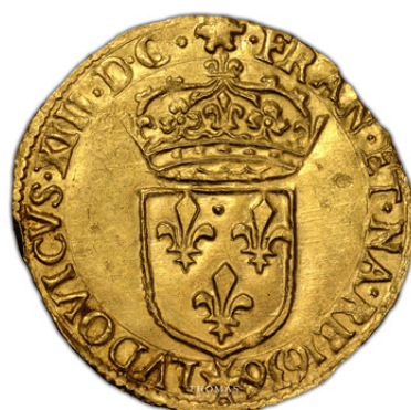
Écu d'or de Louis XIII